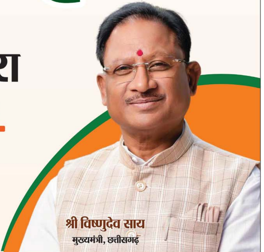
श्री विष्णुदेव साय मुख्यमंत्री, छत्तीसगढ़